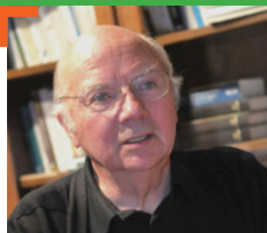
Monseigneur Jacques Gaillot

Rendez-vous le samedi 5 décembre à 17h30 pour une conférence à l'église intitulée : L'avenir est ouvert, ainsi que le dimanche 6 décembre à 10h30 au culte où Monseigneur Gaillot assurera la prédication. Pendant la célébration, les enfants entre 3 et 12 ans sont invités à rejoindre le groupe d'Éveil à la foi pour la préparation de la fête de Noël.