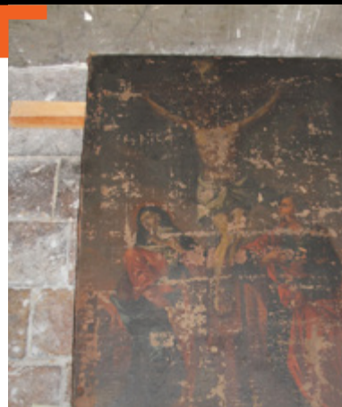
« Le Christ en croix et les saintes femmes » en attente de restauration

Grâce à votre générosité, le financement de la restauration du tableau présenté dans l'Ami n° 329, « le Christ et les deux larrons près du pont » (1704) est assuré. Il partira en atelier courant novembre. Grand merci aux donateurs !