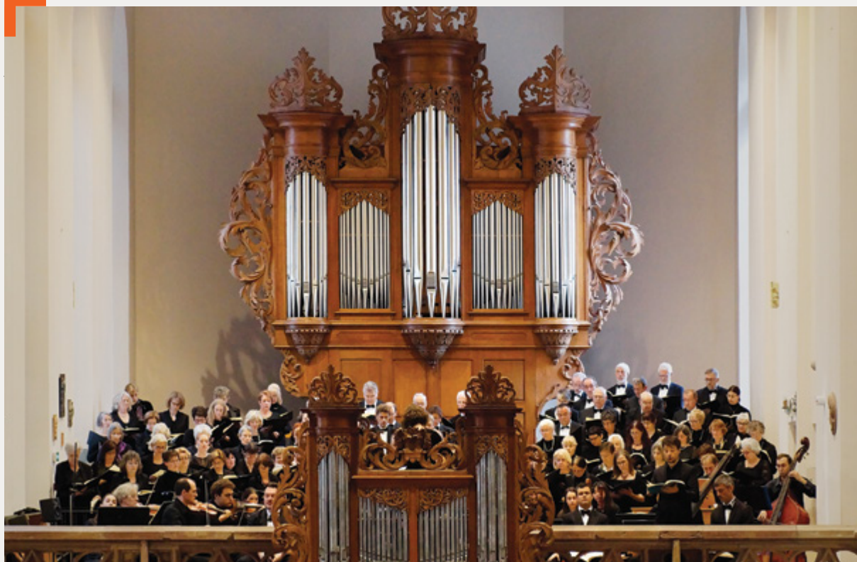
Le Chœur de Saint-Guillaume