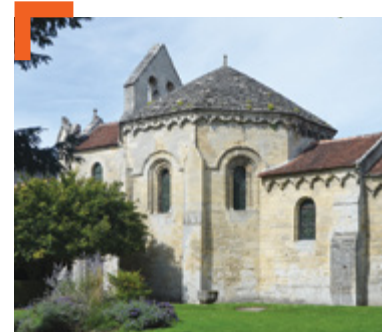
Chapelle de la commanderie des Templiers de Laon

orgueilleux, avides, vivant dans le luxe et les mauvaises mœurs, avec des comportements jugés pervers telle l'homosexualité, montrant de la sympathie à l'égard de l'Islam, etc alors que la vie est devenue de plus en plus difficile du fait des guerres, des impôts élevés, de crises financières et d'une dévaluation monétaire.