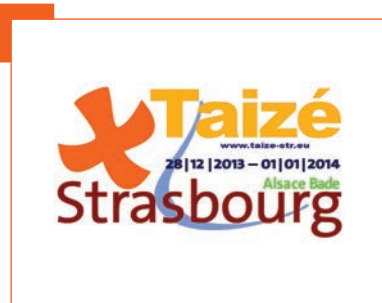
Taizé / 36 ème rencontre

Prêts à dormir par terre, le confort n'est guère de mise pour les jeunes dans le cadre de ce pèlerinage. Un accueil chaleureux compte bien plus que le confort ! Ils seront absents de