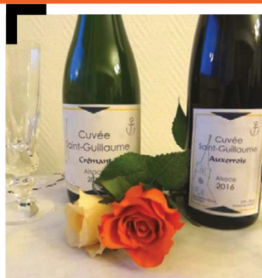
La cuvée Saint-Guillaume

La collecte du concert sera consacrée aux travaux de l'église. C'est aussi dans le cadre de cette soirée que nous mettrons en vente les « cuvées Saint-Guillaume » produites en partenariat avec la prestigieuse maison Ruhlmann-Schutz de Dambach-la-Ville. Il s'agit d'un crémant vendu 8,50 € et d'un Auxerrois vendu 8 €. Pour chaque bouteille vendue, 2 € sont consacrés aux travaux de l'église. Vous pouvez d'ores et déjà passer commande en remplissant le talon ci-dessous.