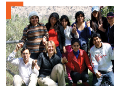
Groupe de bénévoles

l'animation des cultes, al catéchèse et d'autres événements de la vie paroissiale.