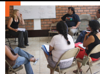
Un temps de formation